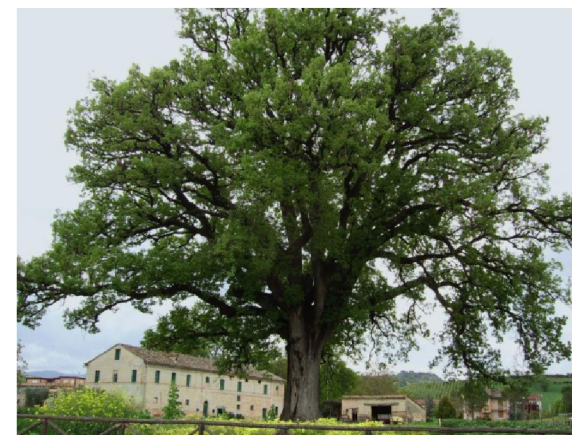
"La quercia centenaria per la pratica yoga di gruppo"

Il seminario sarà allietato da momenti di relax, pranzo e cena a cui possono partecipare anche amici e parenti che accompagnano chi frequenta il seminario Yoga.